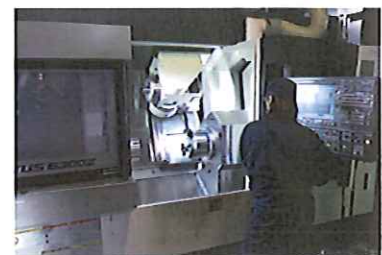
新たに導入した複合加工機で生産合理化

同社は、ポンプ以外の製造において、大手企業からの過剰受注が見られる近隣下請企業のオーバーフロー分を肩代わりし、地元中小企業の信用保持に貢献。また、高槻市のものづくり企業交流会の幹事を務める社長の人的ネットワークを活用して、近隣の同業他社や同業大手企業と技術交流を行い、研究開発を中心に、技術の高度化を図っている。同社の製造工程においても、地元の外注加工業者を積極的に活用。独自の技術開発力とともに、地域に根ざした中小企業として、更なる海外展開を目指している。