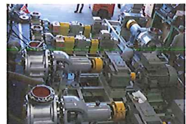
海外石油プラント向け大型内転歯車ポンプ

同社は、顧客目線で使い勝手の良いポンプにこだわり、耐久性に優れ、メンテナンスが容易で、幅広い仕様に対応する製品の製造に重点を置く。移送困難な粘性液体を運ぶ主力製品「内転歯車ポンプ」は、同社の優れた液体輸送技術が認められ、石油化学系プラントを中心に実績を積んでおり、某大手洋菓子メーカーでも同社ポンプを独占的に使用している。東南アジアではメンテナンスを含む安定供給体制を整え、サウジアラビアの石油化学会社に納めた実績を持ち、海外市場でもビジネスを拡大している。