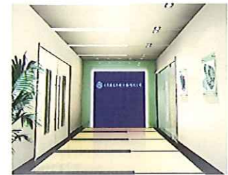
上海に子会社を設置し、中国市場に積極展開

同社は、営業本部に海外事業部を設けることで積極的にグローバル展開を図っている。輸出比率は50%に及んでおり、韓国、中国、台湾、タイ、インドネシア等、海外市場での販売実績を上げている。2006年に中国上海に100%出資現地法人 大同海龍機機(上海)有限公司を設立。量産品は中国での製造に踏み切る一方で、製品設計や主要部品、特注品は日本国内にて製造し、棲み分けを行っている。近年は、欧州にも輸出実績を積み、今後は米国市場開拓も見据える。